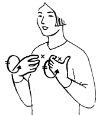
schaap (+klein = lam)