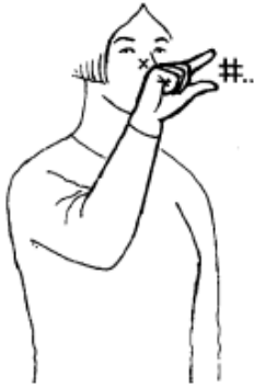
Kip (kleine snavel=kuiken)