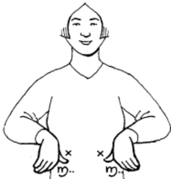
Eend (+klein =kuiken)