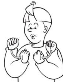
kunnen (niet kunnen is schuddend)