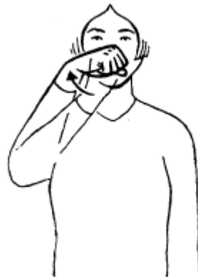
varken (+ klein = big)