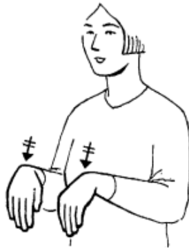
hond (+klein = pup)