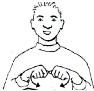
Kraak/ kapot/ gebroken