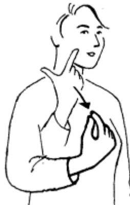
leuk (niet leuk is schuddend)